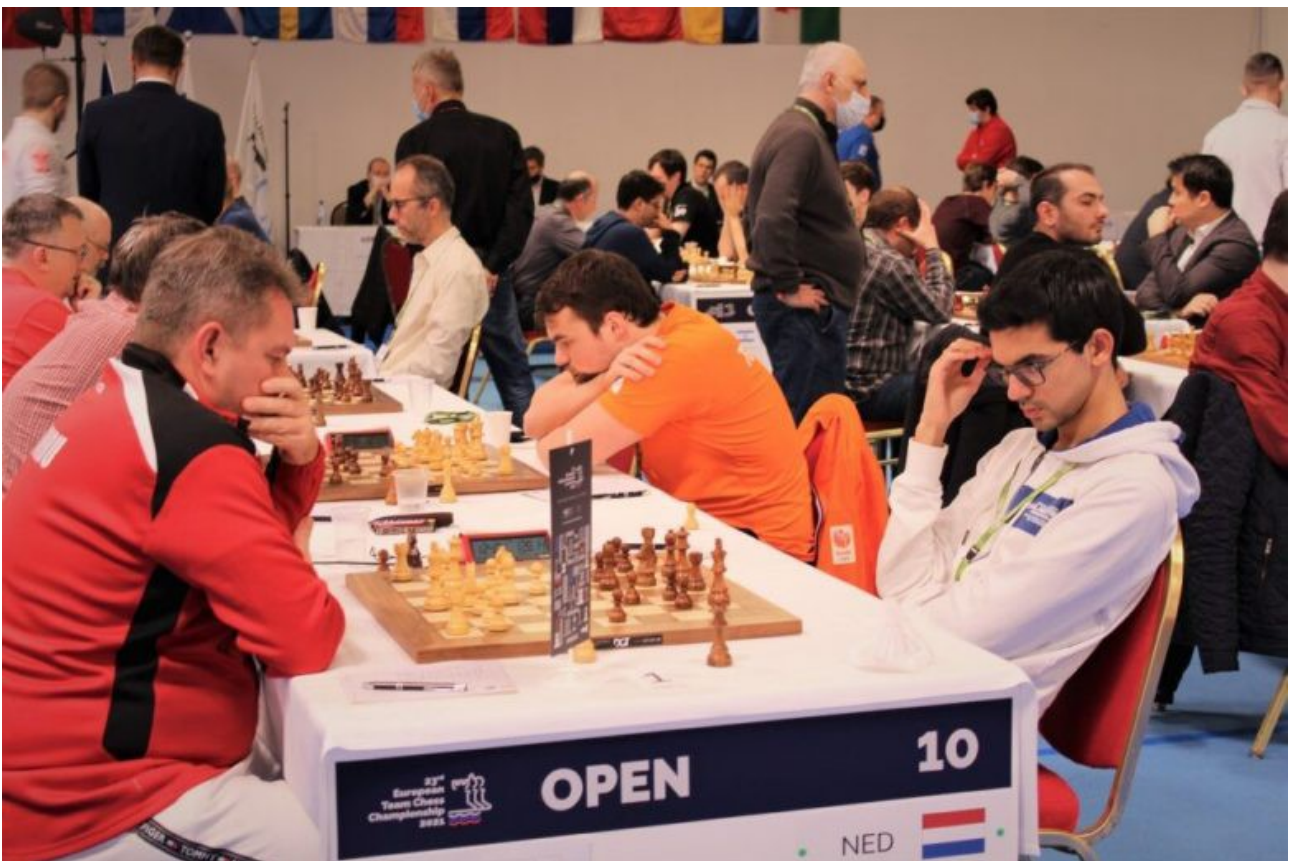
Het Nederlands team in actie tegen Wales

Nederland heeft ondanks de dubbele 2-2 nog alle perspectief op een goed toernooi en een mooie uitslag. Hoe het de Nederlandse heren en dames vergaat op het EK en nog heel veel ander schaaknieuws is te volgen op www.schaaksite.nl .