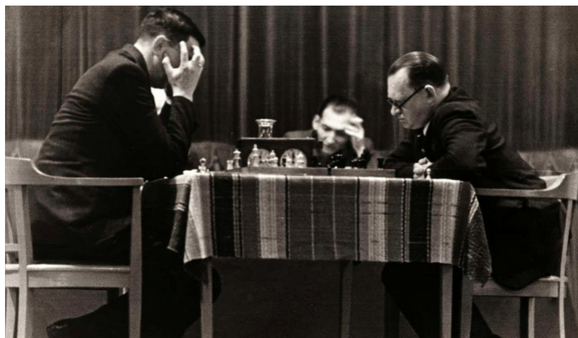
Max Euwe (links) en Alexander Aljechin tijdens hun tweekamp in 1937

Max Euwe (met zwart) speelde hier 1...,Dd5-e5. Een logische zet, zijn dame staat aangevallen en op e5 staat de dame zeer actief. Maar hij overzag een tactisch grapje: 2.Dh8+,Kxh8 3.Pxf7 en wint de dame terug en houdt een in principe gewonnen eindspel over. Maar Aljechin zag dit niet en speelde 2.Lc1-b2. Met 2...,Ld7-c6 gaf Euwe Aljechin een tweede kans. Nu zou Dh8+ zelfs nog gunstiger uitpakken! Nog altijd zag ook Aljechin het niet. Hij speelde 3.a2-a3 en na 3...,Le7-d6 leverde Dh8+ geen voordeel meer op. Ook wereldkampioenen missen wel eens wat.